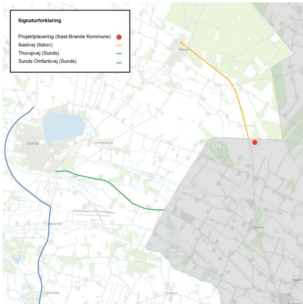
Projektets placering i forhold til det omkringliggende vejnet.