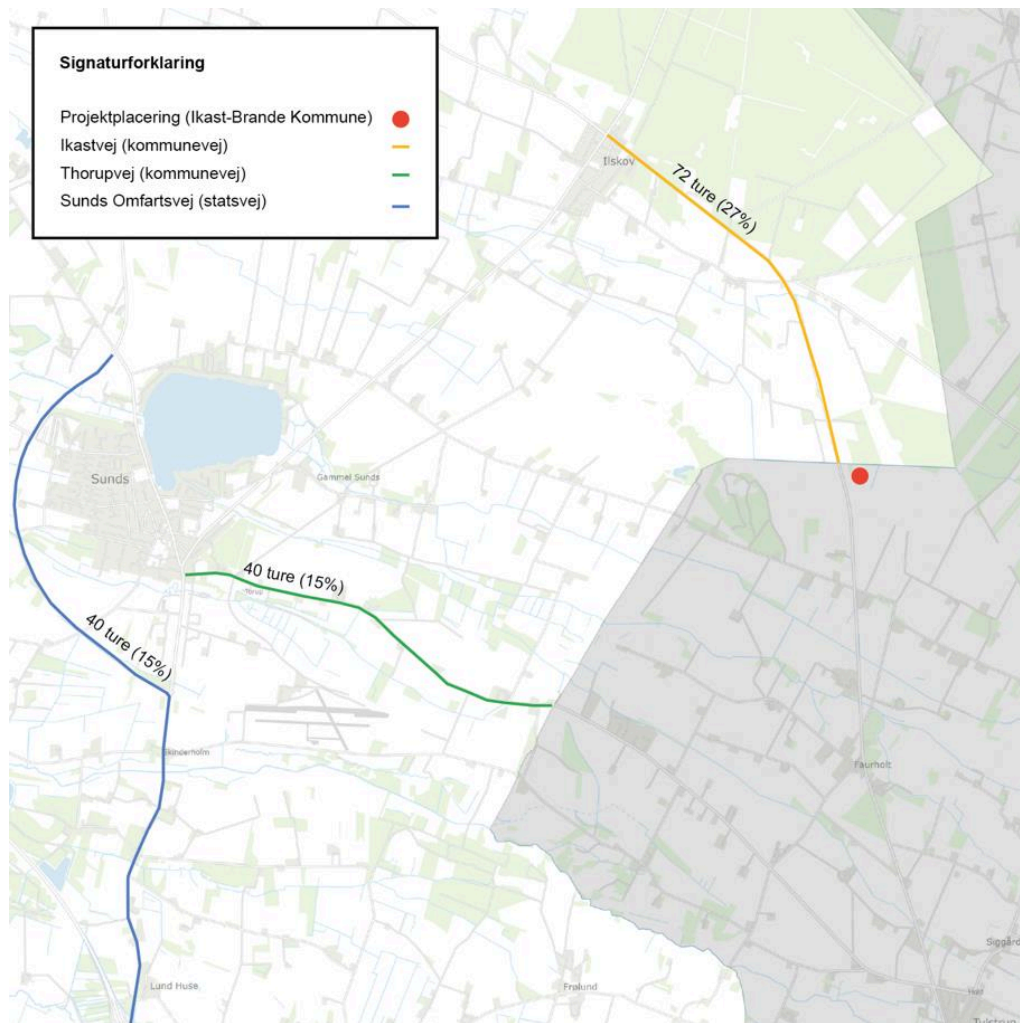
Fordelingen af daglige lastbilture inden for Herning Kommunes vejnet.

Herning Kommunes vejnet er opdelt i vejklasser fra 1-4, der ajourføres jævnligt. Jo lavere en vejklasse er, desto højere er serviceniveauet forbundet med driften af den pågældende vejklasse. Vejklasserne beskriver blandt andet vejens størrelse, kvaliteten af belægningen samt den anslåede kapacitet i forhold til personbiltrafik. Både Ikastvej og Thorupvej er klassificeret som vejklasse 1, hvor sidstnævnte er klassificeret som en "utryk skolevej" på baggrund af antallet af borgerhenvendelser.