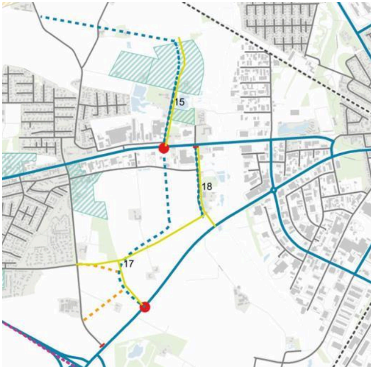
Figur 1 (Krydsløsning ved Langvadbjergvej / Ringkøbingvej / Kæret, Snejbjerg. De gule linjer viser de gældende kommunale vejprojekter fra kommuneplanens bilag 8. De blåstiplede linjer viser indledende overvejelser fra konsulentarbejde til et nyt vejsystem i Snejbjerg.)

På figur 1 fremgår en principskitse til en sammenhængende krydsløsning på tværs af Ringkøbingvej. Begrundelsen for et forslag til en ændret krydsløsning er, at et skævt kryds vil skabe dårlig fremkommelighed og potentielt trafikfarlige situationer. Situationen er specielt farlig når man kommer nordfra og skal mod syd. Her skal man først skal ud på hovedgaden i modsatte vognbane og dernæst til højre med det samme i et nyt kryds.