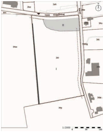
Disponering af lokalplanområdet