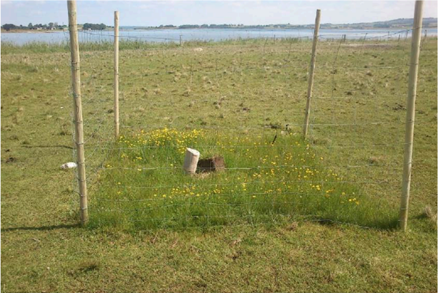
Foto, som viser et forsøgsfelt, der er heget fra et areal med sommergræsning. Bemærk mængden af blomster inde i det lille hegn i forhold til arealet udenfor. (fra DCE-rapport nr. 228).

Ved helårsgræsning vil der være færre dyr på arealet om sommeren, fordi det er den føde, der er tilgængelig om vinteren, der er bestemmende for, hvor mange dyr der kan være på arealet. Derved får planterne bedre mulighed for at vokse op og sætte blomst, hvilket bidrager til naturoplevelsen og samtidig er til gavn for insektfaunaen. Til gengæld vil der være perioder om vinteren, hvor de græssende dyr skal ty til vedplanter og bark for at finde føde nok. På den måde er de med til at holde arealerne lysåbne på en naturlig måde. Ved helårsgræsning sparer man udgifterne til staldanlæg og vinterfodder. Ved sommergræsning, vil man ofte være nødt til at supplere med maskinel nedskæring af opvækst, som dyrene ikke får græsset ned i løbet af sommeren, ligesom man skal investere i vinterfodder til dyrene i den periode de står i stalden.