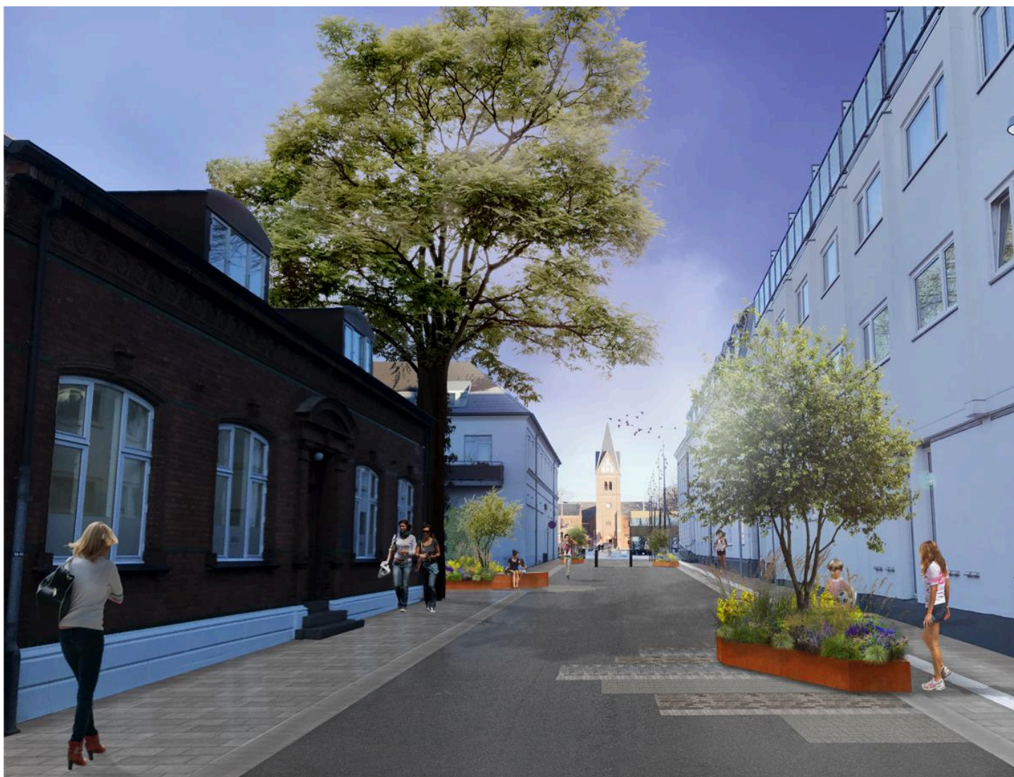
Illustration fra Mindegade i Herning