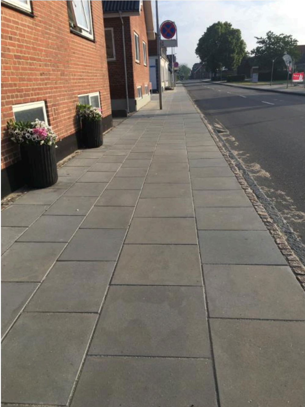
Skolegade i Aulum - Nyt fortov anlagt i 2020 ifm. kloakfornyelse. 10 % af alle fortove vurderes at være i god stand.