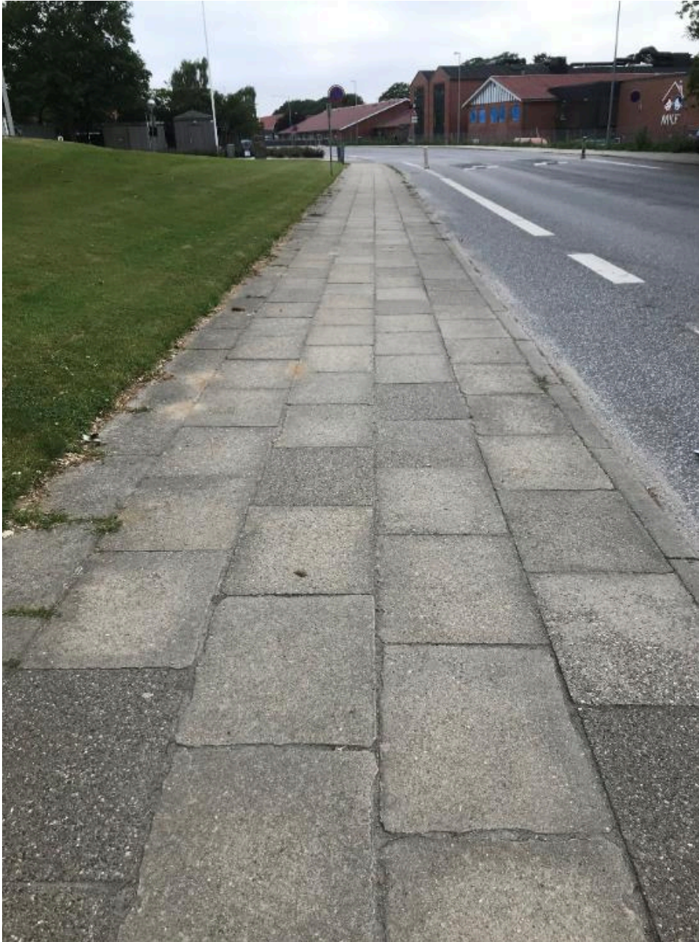
Brændgårdvej i Herning - Fortovet er ca. 30 år gammelt og i middel stand. 50 % af alle fortove vurderes at være i middel stand.