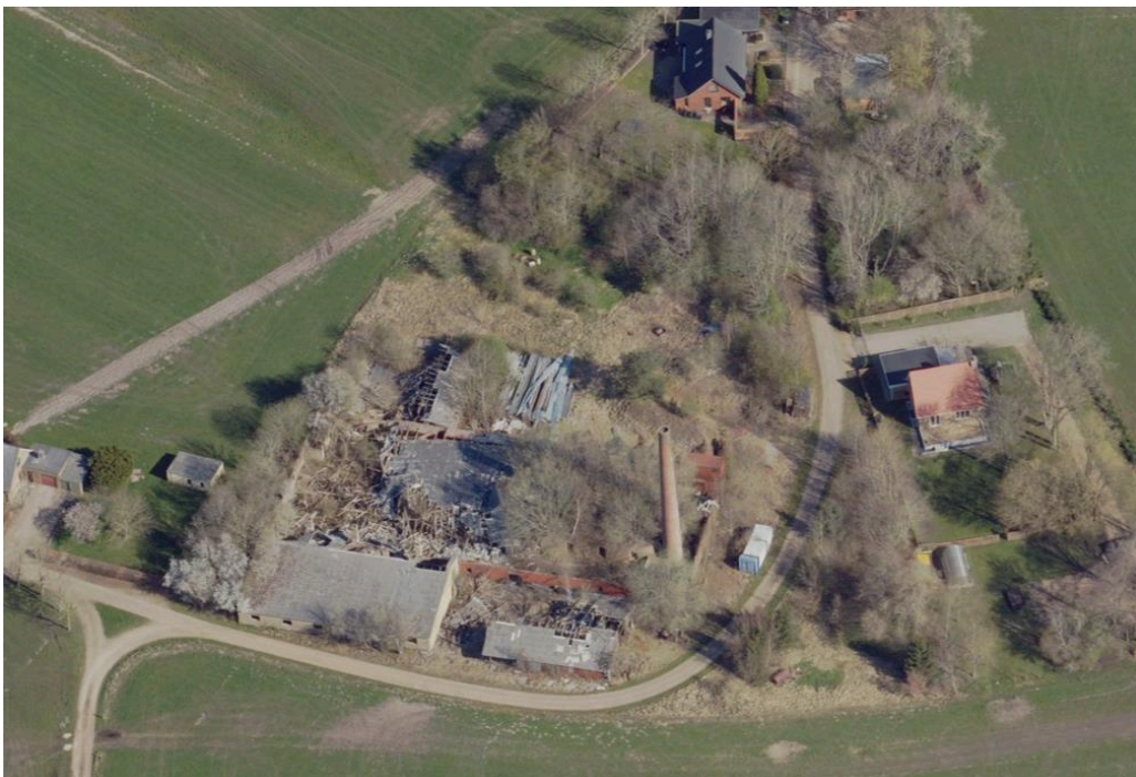
Feldborg Teglværk. Bygningerne har lidt stor skade over de sidste mange år og fremstår meget forfaldne, ligesom store dele af konstruktionerne er styrtet sammen.