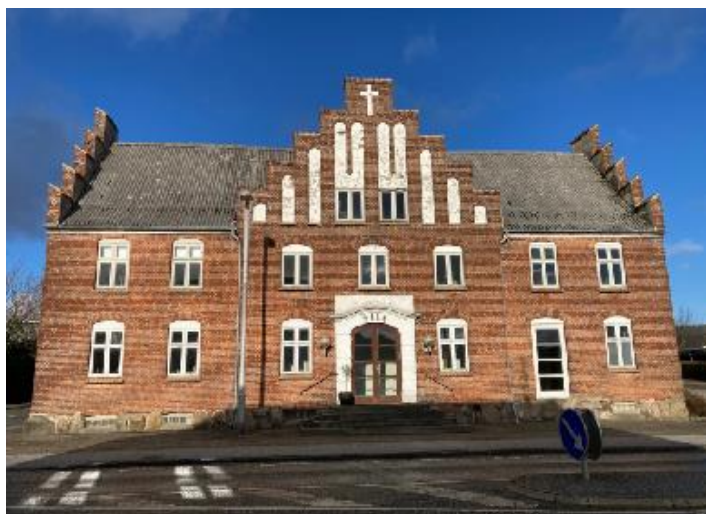
Det bevaringsværdige missionshus "Silo".

For at sikre den bevaringsværdige bebyggelse, indeholder lokalplanen bevarende bestemmelser. Den ældste del af missionshuset "Silo" fra 1923 har en bevaringsværdi på 3 (høj bevaringsværdi). Missionshuset består derudover af to tilbygninger fra hhv. 1940'erne og 1977, som ikke er bevaringsværdige og kan nedrives.