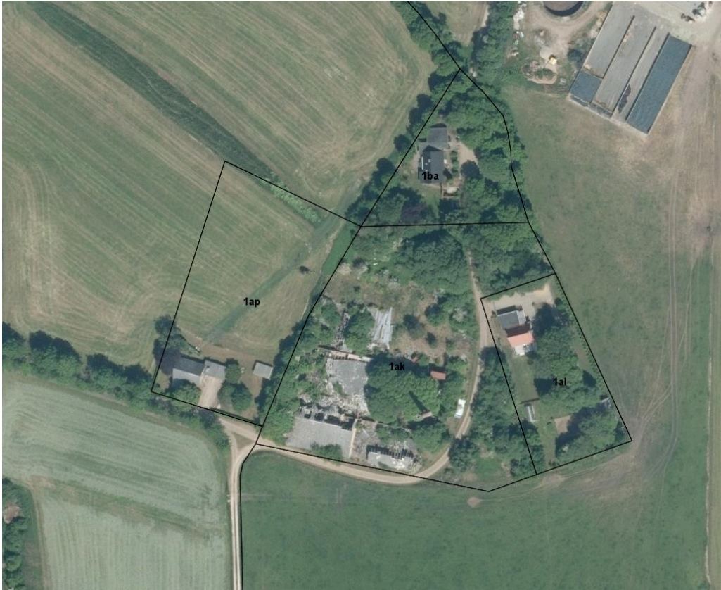
Feldborg Teglværk (beliggende på matr. nr. 1ak, Over Feldborg By, Haderup) samt de tre omkringliggende boliger.