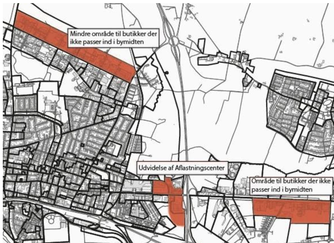
Figur 1. Forventet afgrænsning af kommuneplantillæg nr. 1.

Kommuneplantillægget har ligeledes til formål at udlægge to nye aflastningscentre ved henholdsvis Birk og Vesterholmvej til butikker som outlet, webshop med butiksdel, butikker med særlige transportbehov som køkken og hårde hvidevarer, butikker med et sortiment som indeholder stor del engros, og butikker, der med sortiment ikke typisk betragtes som egentlig detailhandel.