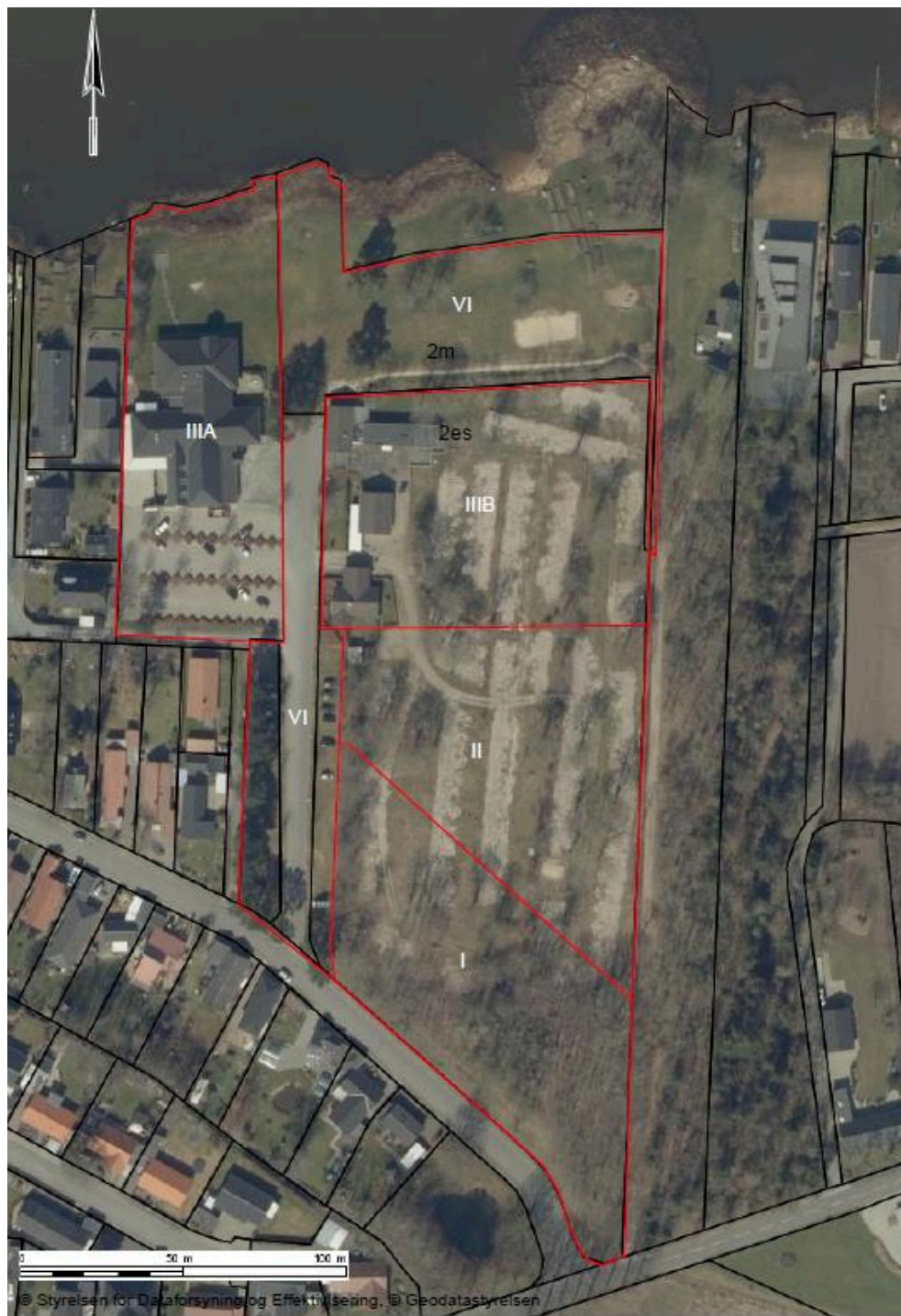
Oversigtskort over delområder