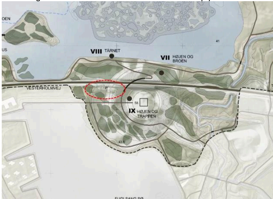
Kort over planlægning af Holing Sø området

Da anden planlægning for Holingområdet formodentlig vil inddrage noget af arealet omkring p-pladsen, har forvaltningen kun kunnet lave en mindre udvidelse af p-pladsen samt renoveret belægningen.