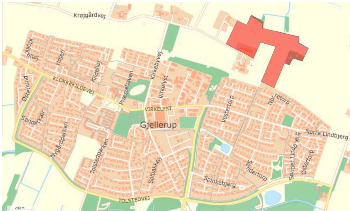
Kort: Ejendommen Krøjtvej 25

Det oplyses, at de 4 folde til avlsheste har en størrelse, så græsset ikke skal omlægges, og samtidigt giver deres størrelse en fleksibilitet i forhold til dyreholdet på ejendommen, hvor antallet af føl og ungheste kan variere i forhold til reproduktionen, tidspunkt for salg af føl og ungheste osv. Det anføres, at hvis det ikke muligt at benytte de 4 folde med hvert deres læskur, så bliver det nødvendigt for ansøger at leje plads på andre husdyrbrug, hvilket er u hensigtsmæssigt og ødelæggende for ejendommens sundhedsstatus, hvorved det reelt ikke er et alternativ.