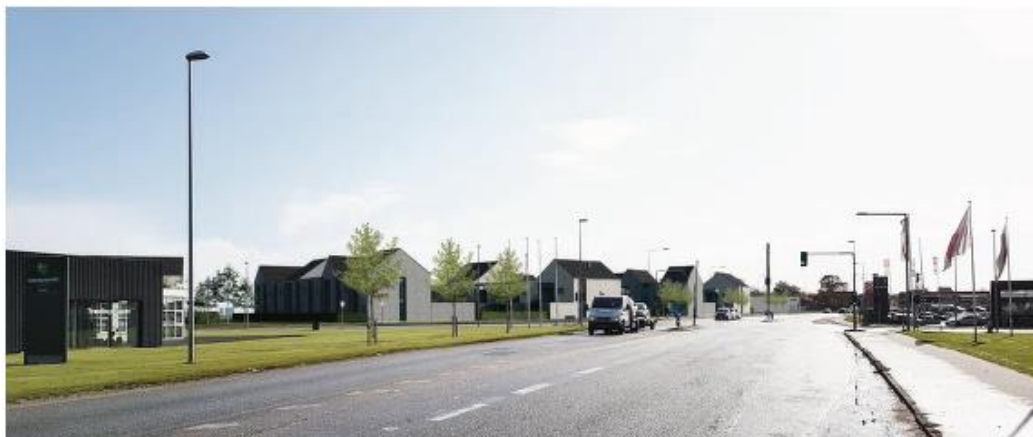
Bebyggelsen set fra nord fra Messevejen