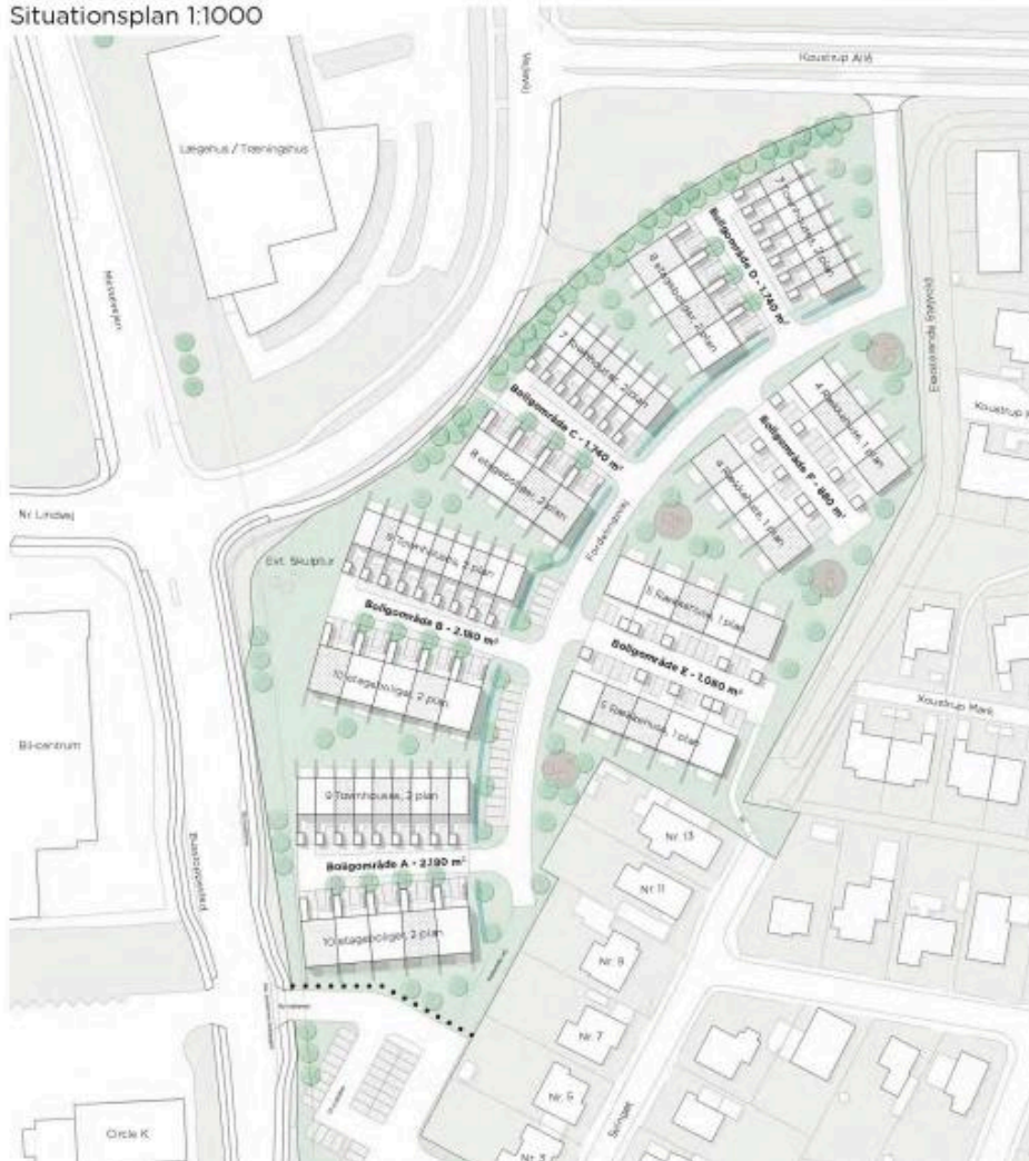
Nyt skitseforslag 1:1000