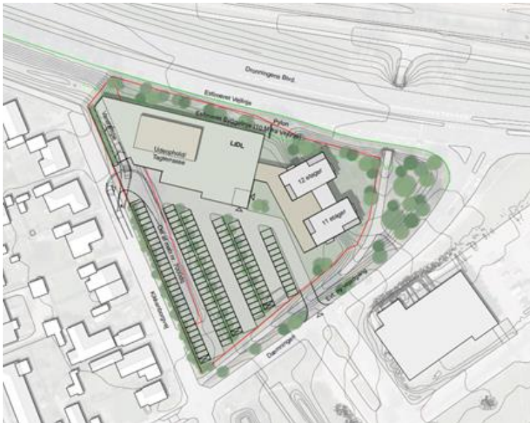
Projektforslag for Kikkenborg 12

Projektforslaget for Dæmningen omfatter en udvidelse af en eksisterende dagligvareforretning på minimum 100 m 2 til 'bake-off' på bygningens sydøstlige facade. Ansøger ønsker endvidere mulighed for senere at kunne udvide med yderligere 200 m 2 .