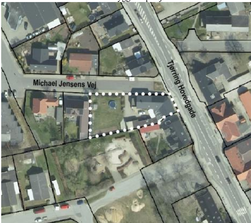
Luftfoto med ejendommen Tjørring Hovedgade 57 markeret

Ejendommen Tjørring Hovedgade 57 er beliggende på hjørnet af Tjørring Hovedgade og Michaels Jensens Vej i Herning og består af en erhvervsdel og en boligdel. Mange af naboejendommene anvendes kun til boligformål. Ejer har ansøgt om at måtte anvende eksisterende bebyggelse på ejendommen udelukkende til bolig og dermed nedlægge erhvervsdelen helt.