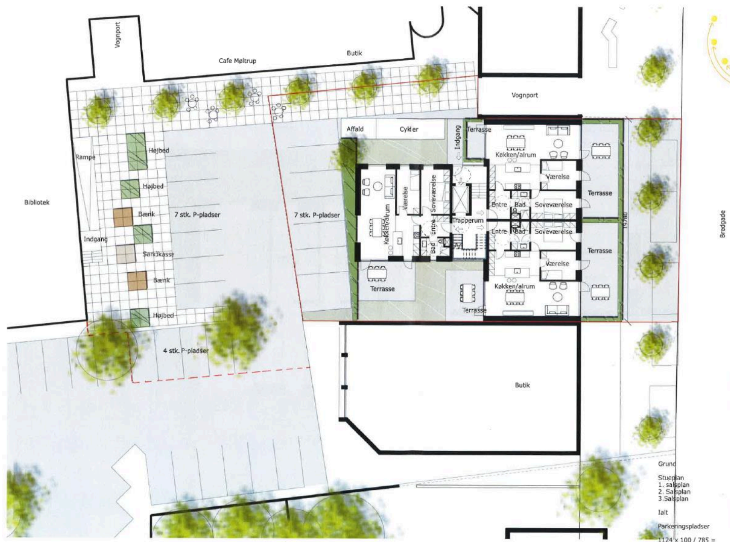
Projekt ved biblioteket i Vildbjerg

Forvaltningen har set nærmere på projektet og kan anbefale, at der i stedet for udføres to projekter, som beskrevet nedenfor.