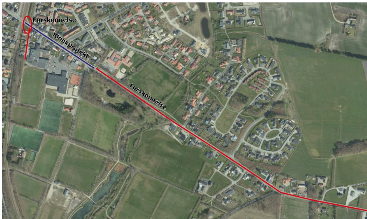
Østergade i Vildbjerg