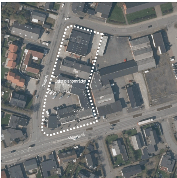
Oversigtskort over lokalplanområdet

Lokalplanområdet grænser op til et område med blandede byfunktioner.