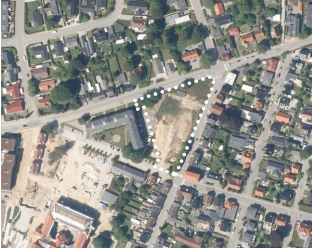
Luffoto med lokalplanområdets afgrænsning markeret med hvide prikker