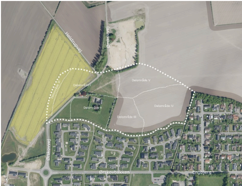
Oversigtskort over lokalplanafgrænsning og delområder.