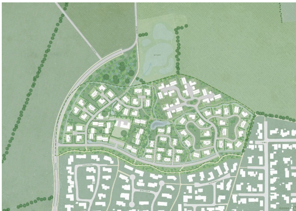
Dispositionsforslag af lokalplanområdet.

Lokalplanen fastsætter at ny bebyggelse kan opføres i op til to etager og i en maksimal højde af 8,5 meter. Lokalplanen muliggør at bebyggelsen og den enkelte bolig kan fremstå i en variation af farver, materialer, form og boligtypologi, hvilket giver lokalplanområdet en varieret arkitektonisk karakter.