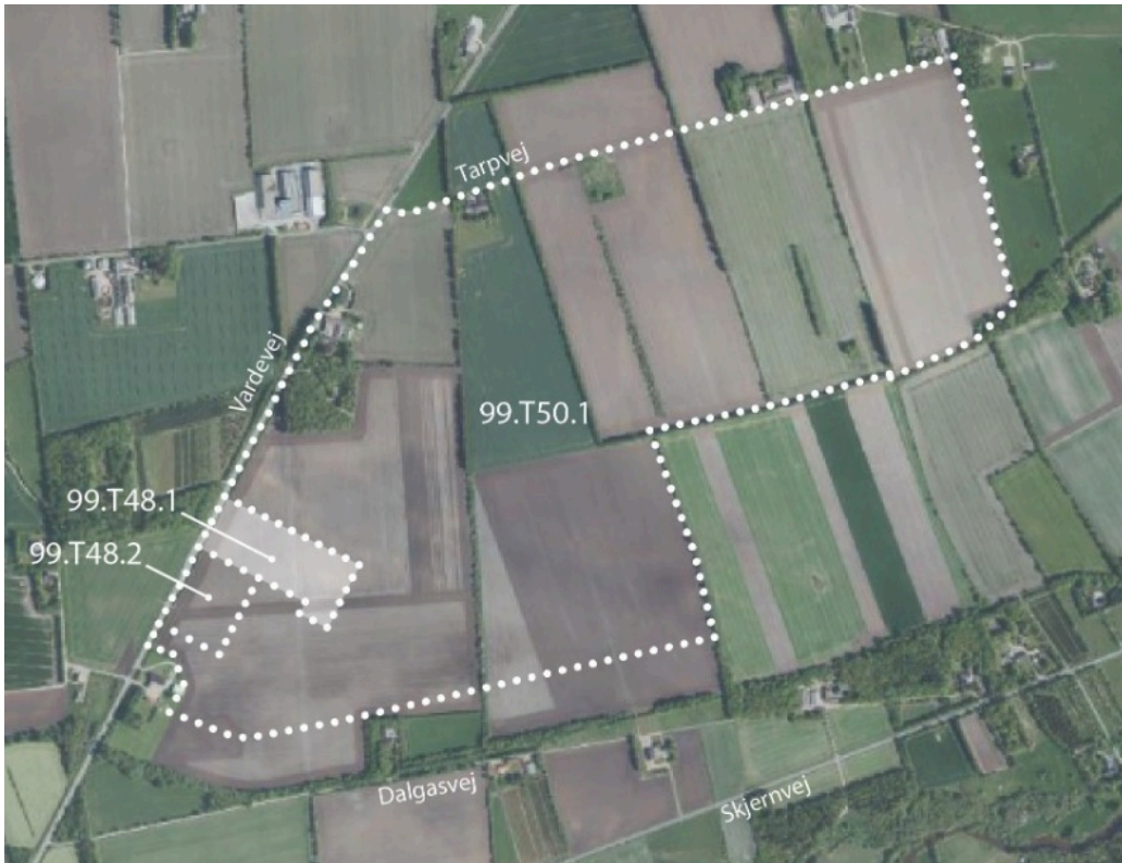
Lufffoto af lokalområdet. Lokalplan 99.T50.1 er under udarbejdelse.