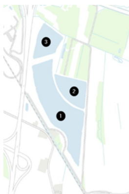
Figur 2: Oplæg til sejlads i Knudmosesøerne. Sø 1 Herning Vandski og Wakeboard Klub. Sø 2 Herning Jetski Klub. Sø 3 Ingen aktivitet

Der er boliger i umiddelbar nærhed af søen, og der er udarbejdet en støjrapport og efterfølgende støjmålinger i en prøveperiode (1.sep-30.okt 2018).