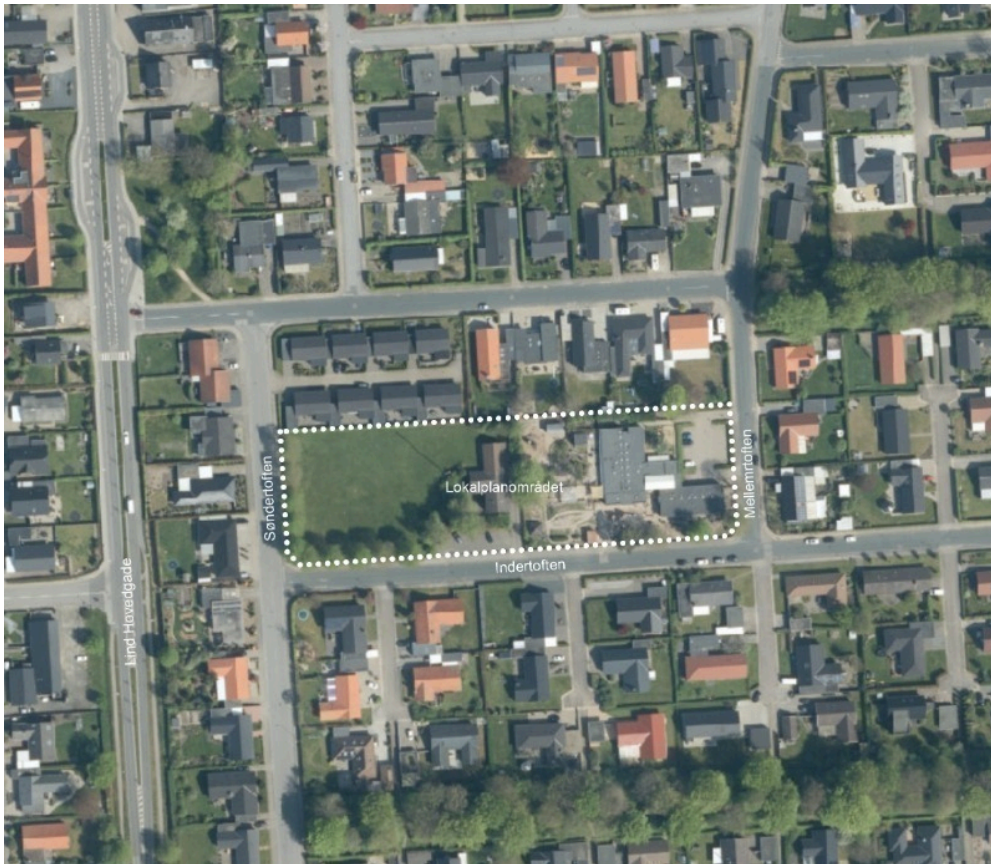
Oversigtskort over lokalplanområdet.