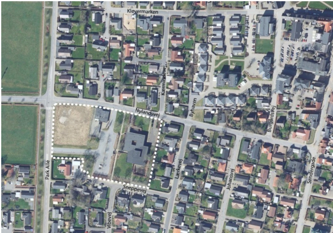
Oversigtskort over lokalplanområdet