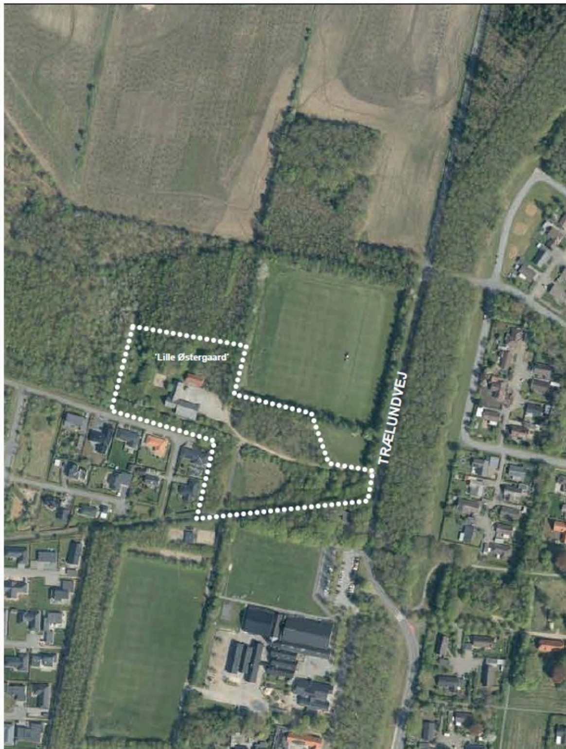
Luftfoto af lokalplanområdet og de nære omgivelser.

En stor del af lokalplanområdet benyttes i dag som offentligt rekreativt område, hvor der er etableret stisystem. Bebyggelsen har indtil for få år siden været anvendt som institution af Herning Kommune. Bebyggelsen "Lille Østergård" har oprindeligt haft status som gårdbrug, med fritliggende stuehus opført i 1931 og tilhørende stald- og ladebygning.