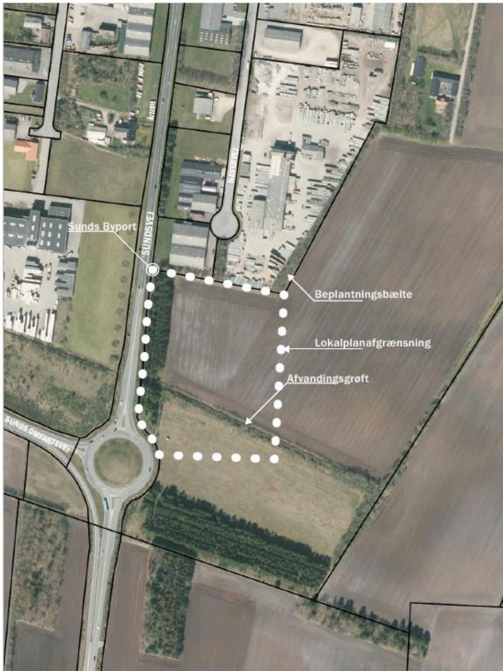
Luftfoto af lokalplanområdet og de nære omgivelser, 2019.