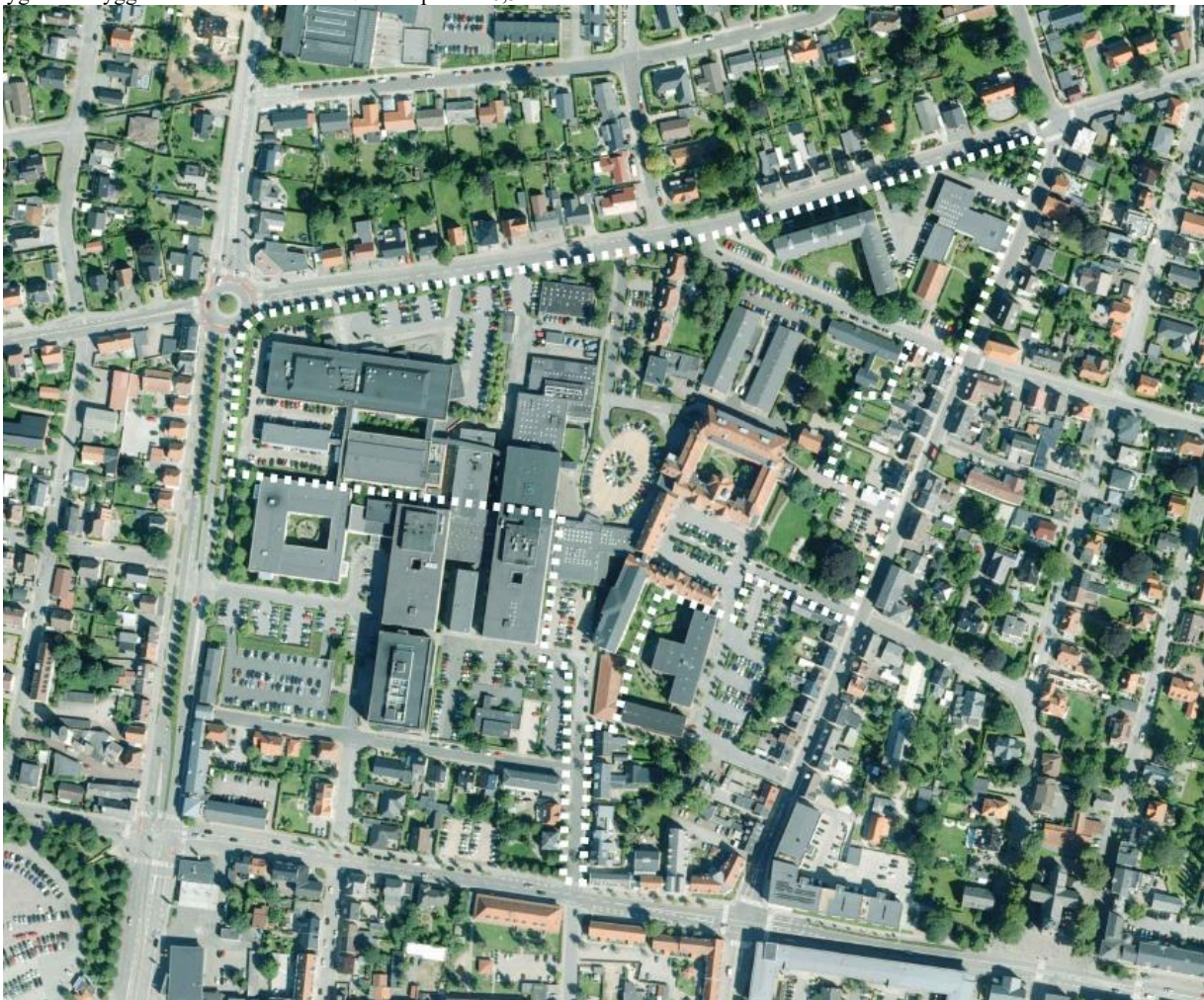
Luftfoto med lokalplanens afgrænsning

Lokalplanområdet er beliggende umiddelbart nord for Herning bymidte og afgrænses af Møllegade, Gl. Landevej, Skolegade samt den sydlige del af sygehusbebyggelsen. Området har en størrelse på ca. 10,5 ha.