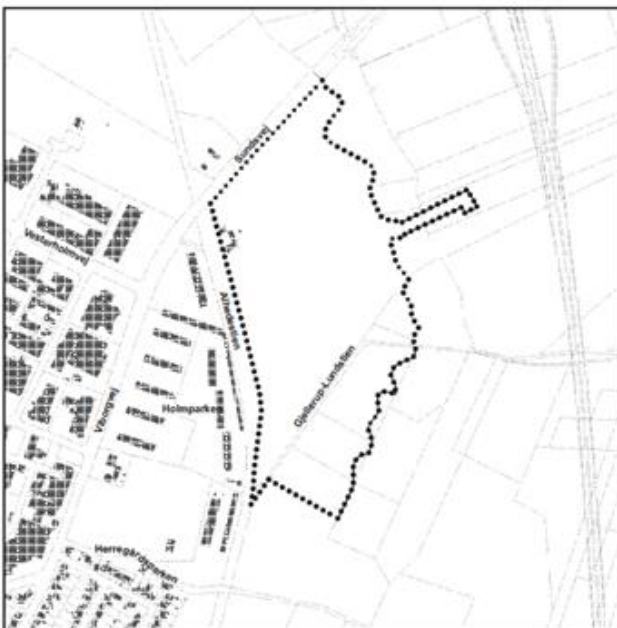
Figur. 1. Oversigtskort for hele Engholm Søpark i Herning, uddrag af lokalplan 12.B7.1 for Engholm Søpark.

Engholm Søpark - Område til boliger, dagligvarebutik og fritidsformål ved Sundsvej